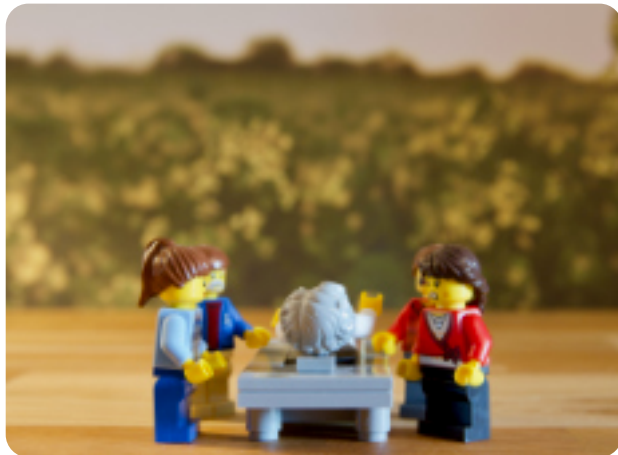
Abschied vom verstorbenen Menschen nehmen