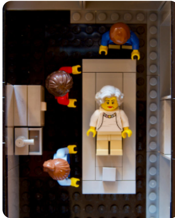
Bei der Einäscherung dabei sein