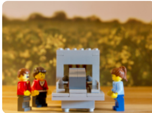
Bei der Einäscherung dabei sein